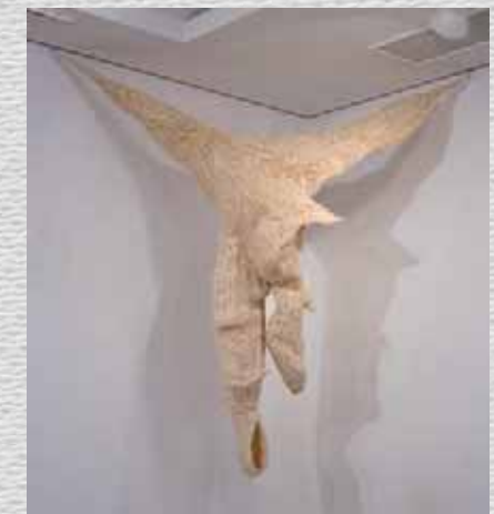
Y. Okamoto Vida 生物