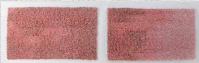
Shimomura Flor 下村 好子