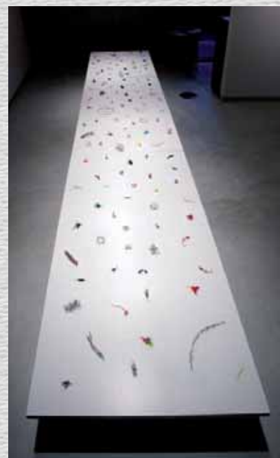
Nakashima Tiempo 中島 俊市郎