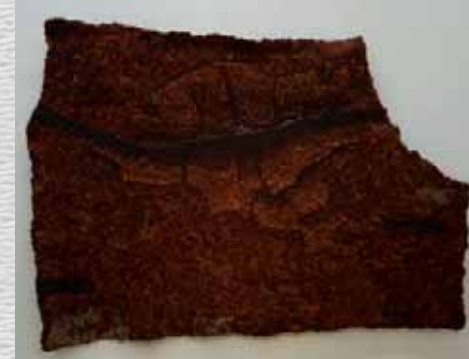
N. Okamoto Monte 岡本 直枝