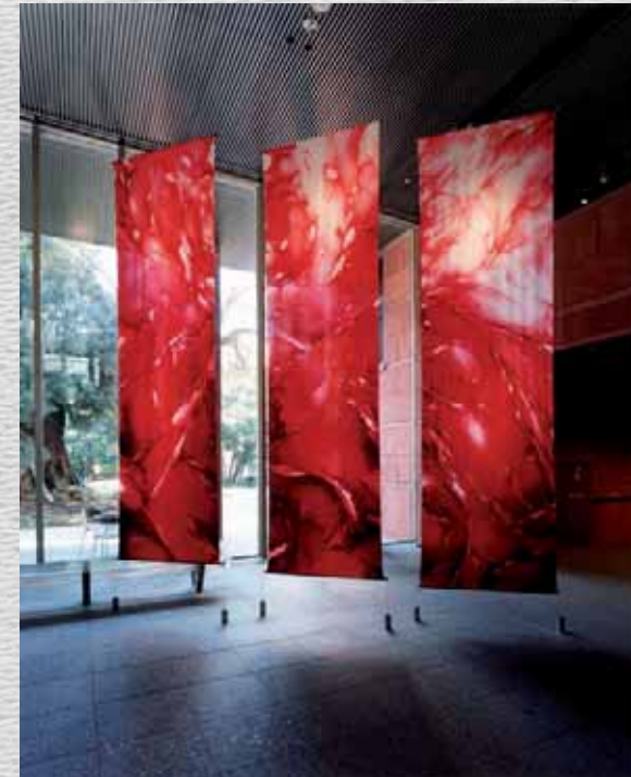
Fuji Sol 藤井 尚子