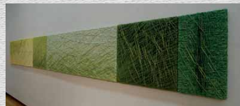
Shimoshige Bosque 下重 泰江